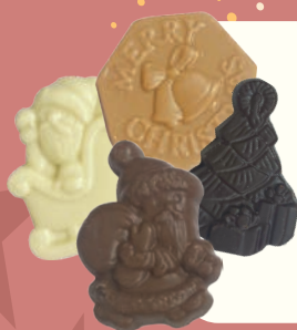
FRITURE NOËL ASSORTIE 150G • REF : IC0610