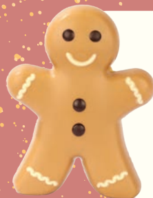
PAIN D'ÉPICES BLANC CARAMEL 100G • REF : IC1871