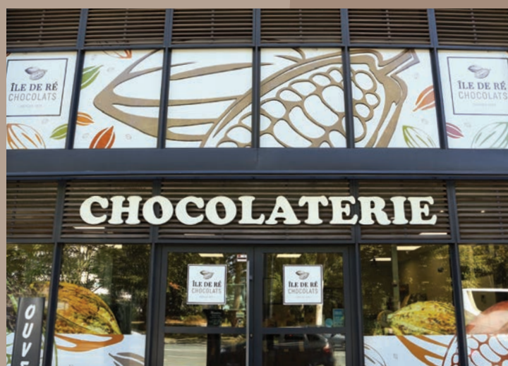
MAGASIN LA ROCHELLE