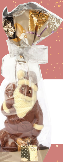
PÈRE NOËL CADEAU LAIT 125G • REF : IC1900