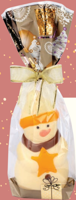
BONHOMME DE NEIGE BLANC 150G • REF : IC1787

Tous nos moulages sont fabriqués sans colorants artificiels et sont décorés à la main pour une authenticité parfaite.